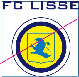
1. De minimale ruimte om het logo te verkleinen