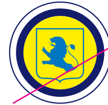
3. De positie van het beeldmerk ten opzichte van het woordmerk te wijzigen