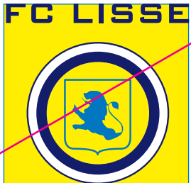
4. Het logo op een klein ondergrondvlak te plaatsen zodat het lijkt of het logo in een vlak hoort te staan