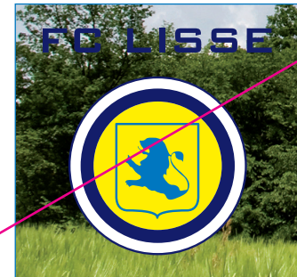
6. Het logo op een fotobeeld te plaatsen met hinderlijke tekening die de leesbaarheid van het logo negatief beïnvloedt.