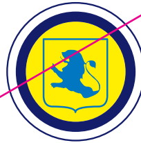
2. De typografie in het logo te wijzigen of te vervangen